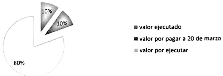
Grafico N°3. Liquidación UTL