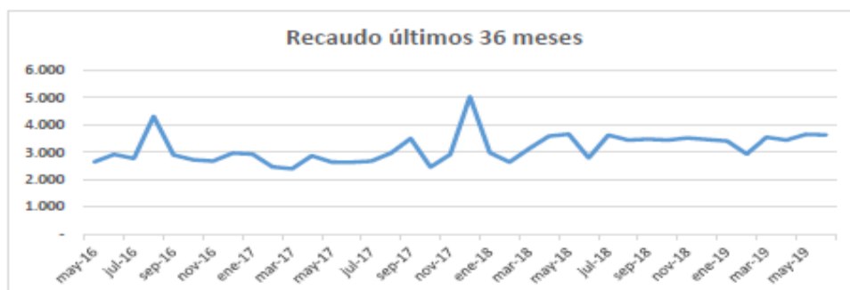
Ilustración 7 Recaudo últimos 36 meses