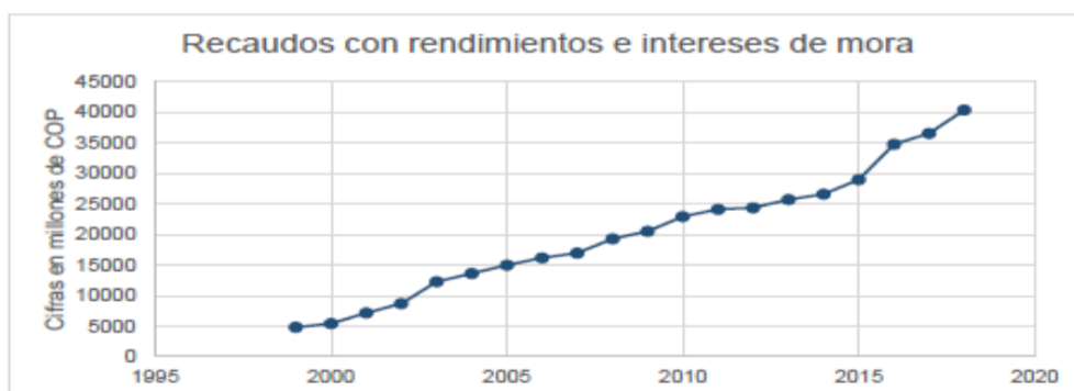
Ilustración 6 Ingresos

En la siguiente ilustración se muestra los ingresos del proyecto.