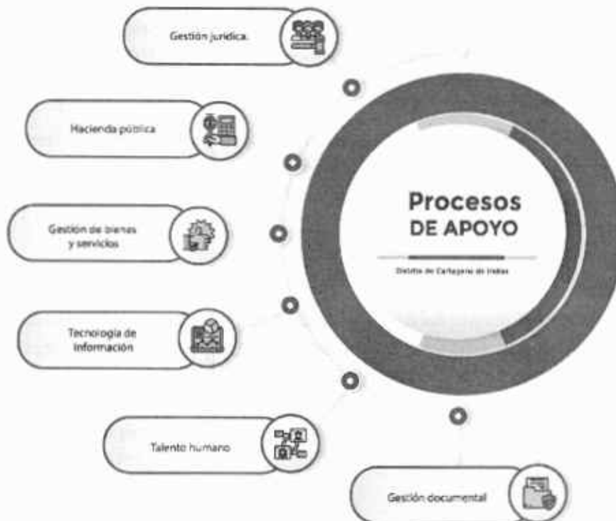
ILUSTRACIÓN 6. PROPUESTA DE PROCESOS DE APOYO

Elaboración: Programa de Modernización y Rediseño Institucional