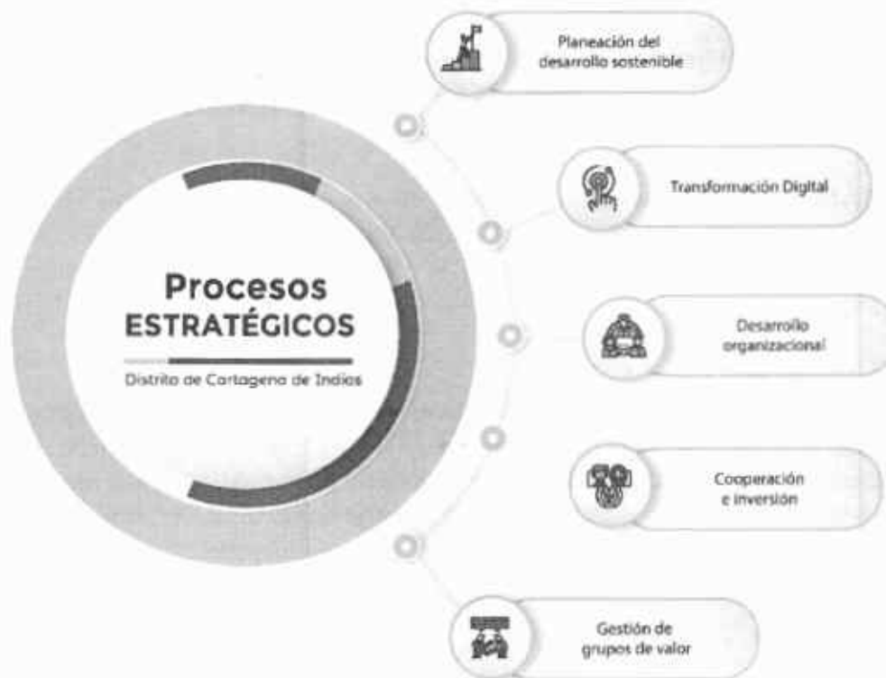
ILUSTRACIÓN 4. PROPUESTA DE PROCESOS ESTRATÉGICOS

Elaboración: Programa de Modernización y Rediseño Institucional