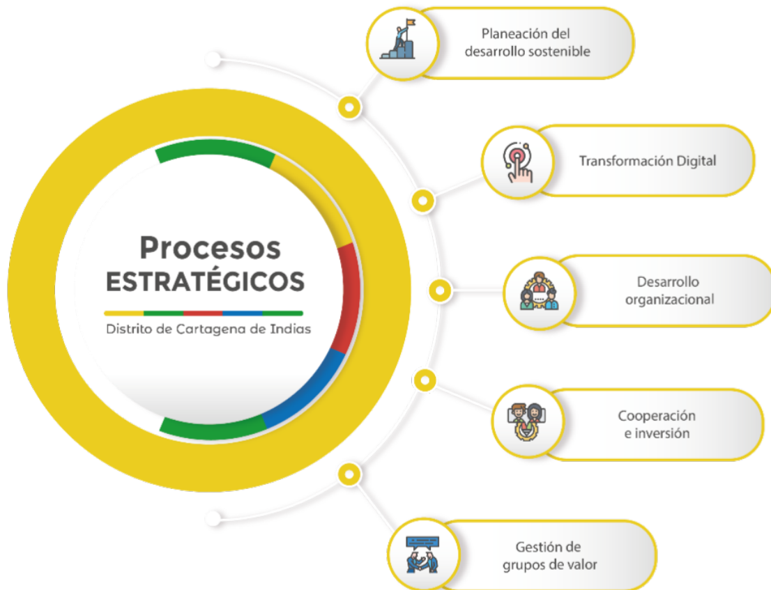
ILUSTRACIÓN 4. PROPUESTA DE PROCESOS ESTRATÉGICOS

Elaboración: Programa de Modernización y Rediseño Institucional