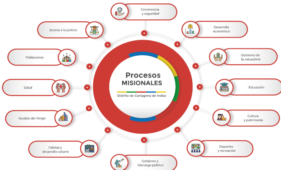
ILUSTRACIÓN 5. PROPUESTA DE PROCESOS MISIONALES

Elaboración: Programa de Modernización y Rediseño Institucional