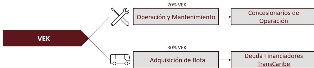
Gráfica. Distribución tarifa VEK entrega Transcaribe Operador

La adición de la porción No. 2 se realizaría a los contratos vigentes de operación, la cual establecería que ambos concesionarios estarían encargados de la operación y mantenimiento de la flota mientras que Transcaribe ente gestor, estaría encargado de cubrir los compromisos relacionados con la flota. Esto debido a que seguirá siendo propietario de esta.