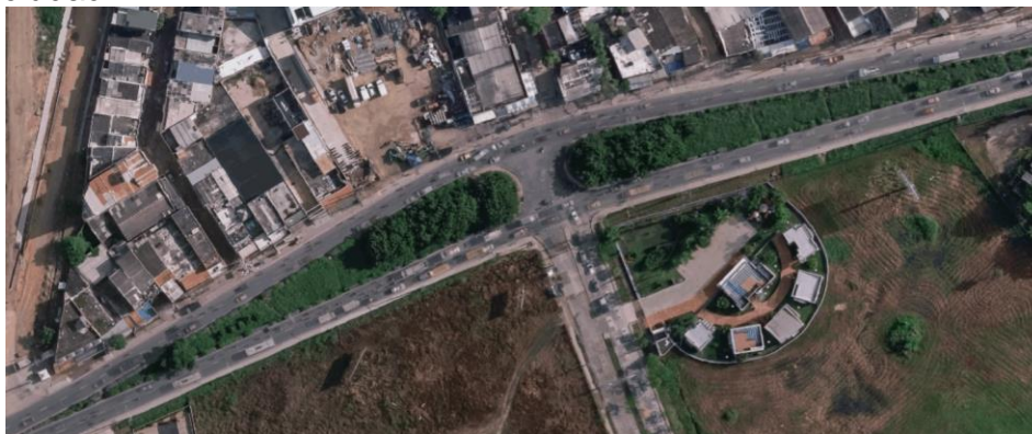
Figura 1.2. Estado Actual de la vía

La Transversal 54 o vía la Cordialidad, está compuesta por 2 calzadas de 2 carriles cada una, con estructura de pavimento flexible, con anchos promedio de 7 metros por calzada, la vía conduce en sentido noroccidente a nororiente hacia diferentes puntos importantes de la ciudad como el Centro Comercial Gran Manzana, la terminal de transporte y la salida hacia las diferentes ciudades del norte del país y/o a la variante Mamonal Gambote, en sentido nororiente a noroccidente hacia vías principales como la avenida pedro de Heredia, avenida del bosque y avenida pedro romero que conectar con el interior de la ciudad.