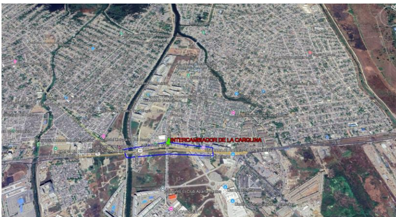
Figura 1.1. Localización de la vía

El denominado proyecto intercambiador de la carolina abarcará su ejecución desde el box que permite el paso del agua del canal calicanto hasta uno 670 metros que coinciden con la olímpica de Villa Estrella.