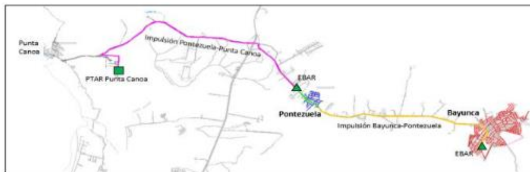
Ilustración: Esquema General Sistema de Alcantarillado Bayunca y Pontezuela

La construcción del alcantarillado sanitario en los corregimientos de Bayunca y Pontezuela del Distrito de Cartagena, busca mejorar las condiciones de recolección y disposición de aguas residuales de los corregimientos mencionados.