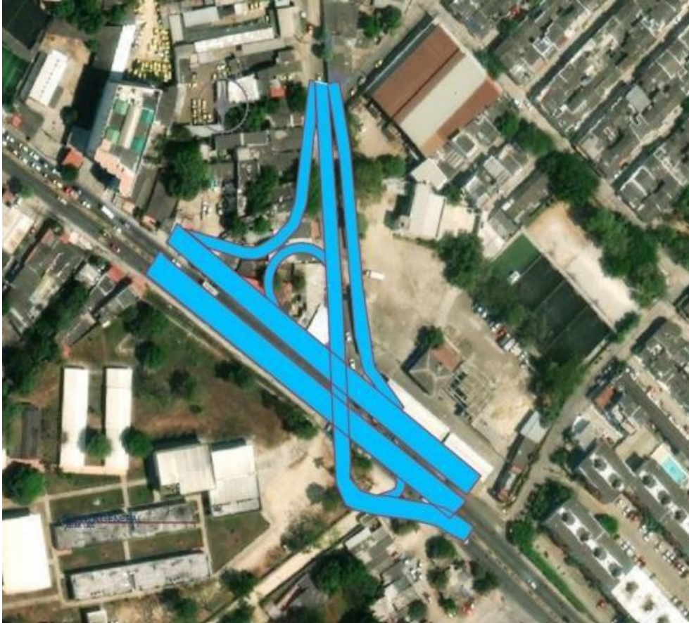
Figura 3. Propuesta de intervención.

Además, se proponen dos vías de enlace con sus respectivos carriles de aceleración cada una: la primera en sentido Este-Oeste (Sentido Ternera – El Amparo), que permita la movilidad de quienes se dirigen desde San José de los campanos, Providencia, El Recreo y sus alrededores. La segunda vía de servicio, La tercera vía de servicio, en el sentido Oeste-Este, facilita la movilidad de los habitantes del Recreo, Providencia, Parque Heredia, incluyendo carriles de incorporación que permiten que quienes ingresen o salgan del sector de San José los Campanos y Municipio de Turbaco o Variante Cartagena. La solución descrita se presenta gráficamente a continuación.