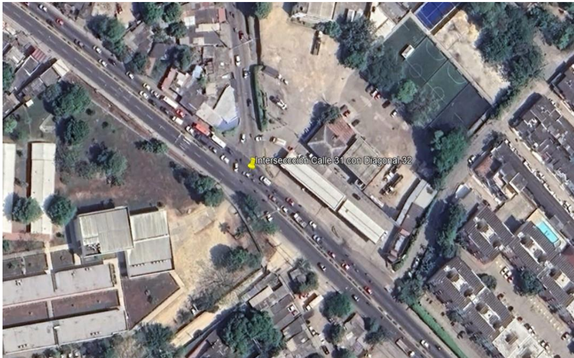
Figura 2. Localización de la vía.

La Calle 31 o Av. Pedro Heredia está compuesta por 2 calzadas de 2 carriles cada una, con estructura de pavimento flexible, con anchos promedio de 7 metros por calzada, la vía conduce en sentido noroccidente a nororiente hacia la salida en sentido al municipio de Turbaco, a la variante Mamonal Gambote, en sentido nororiente a noroccidente hacia vías principales como la Avenida Pedro de Heredia, Avenida del Bosque y Avenida Pedro Romero que conectar con el interior de la ciudad.